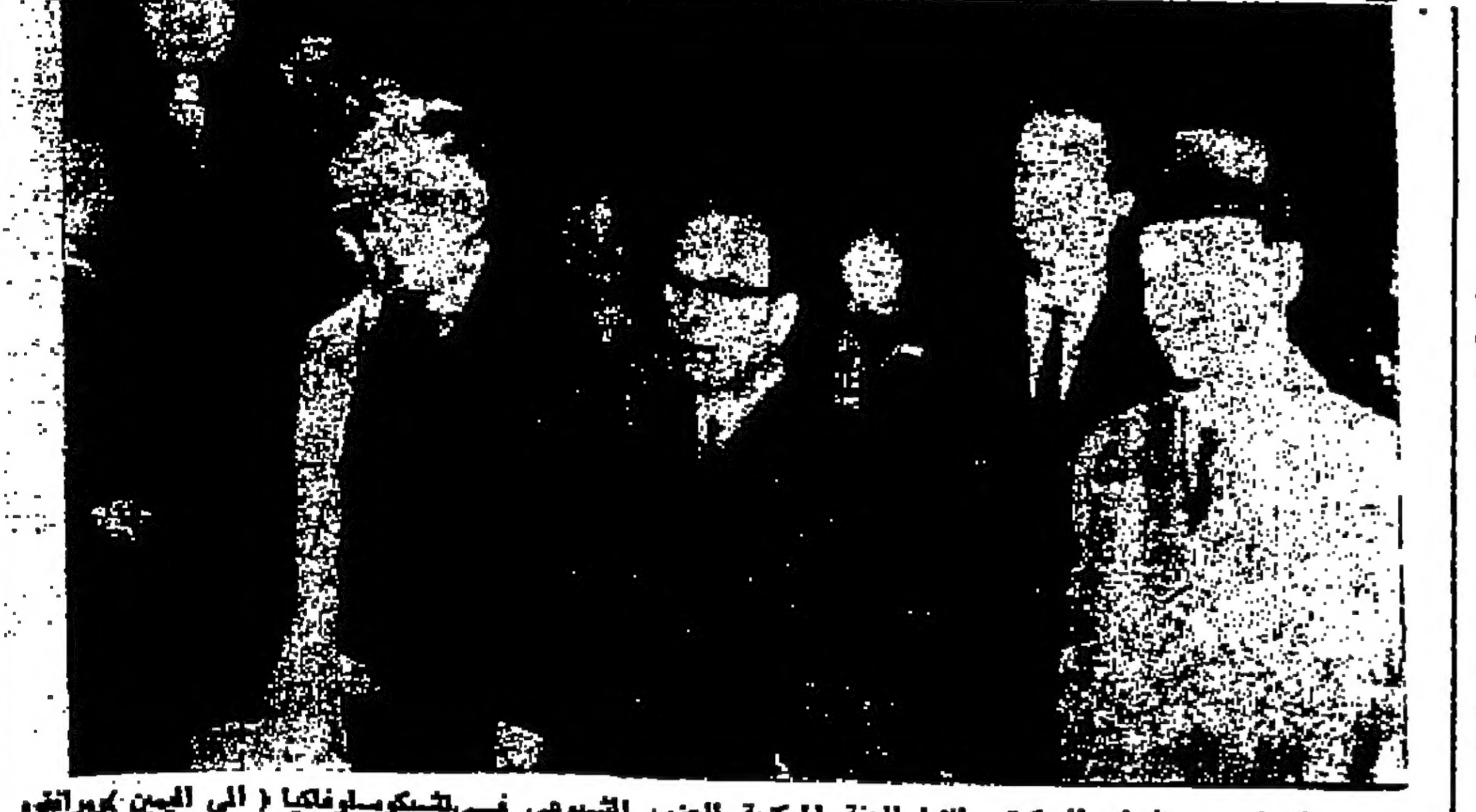
الكتور دويشك السوكر الاول للجنة المركزية للحزب الشيوعي في سوريا (اليمين) مع مرافقيه وهم بقادرون مطار براغ بعد وصولهم برسكو يوم امس

حافظ العسمة حكمت مهيسر رئيس اللجنة اللوائية للتعليم والابنية في العاصمة